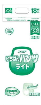
アウターパンツ用