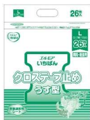
アウターテープ止め用