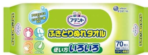
使い捨ておしりふき